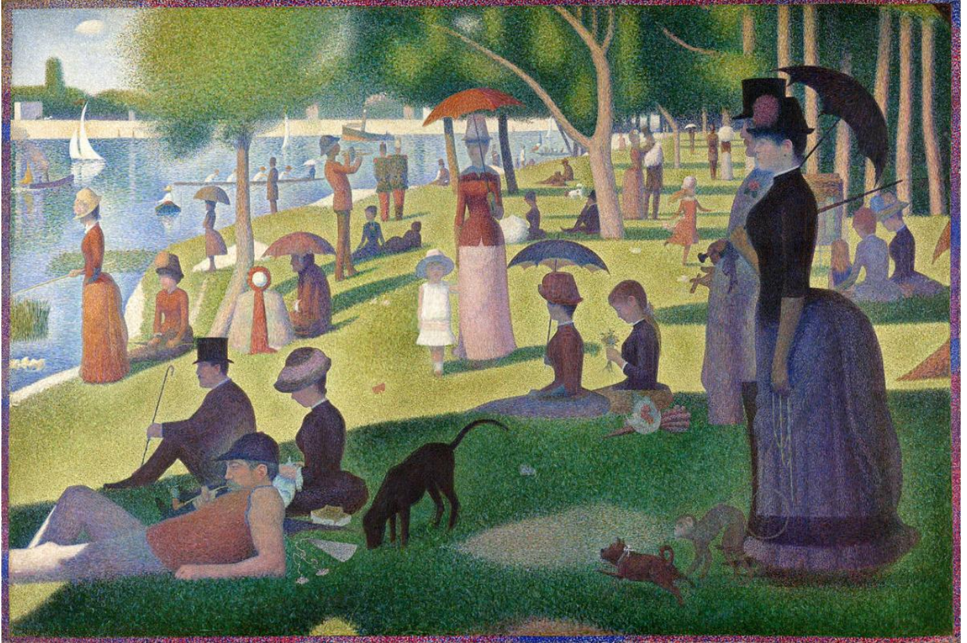
Georges-Pierre Seurat, A Sunday Afternoon on the Island of La Grande Jatte , 1884–1886 Georges-Pierre Seurat, ป้ายวันอาทิตย์บนเกาะ La Grande Jatte, 1884-1886

You are allowed to use phone or computer-based translation for this assignment. If you do, please send the results to: ddrapak@gnspes.ca . คุณได้รับอนุญาตให้ใช้โทรศัพท์หรือการแปลคอมพิวเตอร์ที่ใช้สำหรับงานนี้ ถ้าคุณทำกรุณาส่งผลให้: ddrapak@gnspes.ca