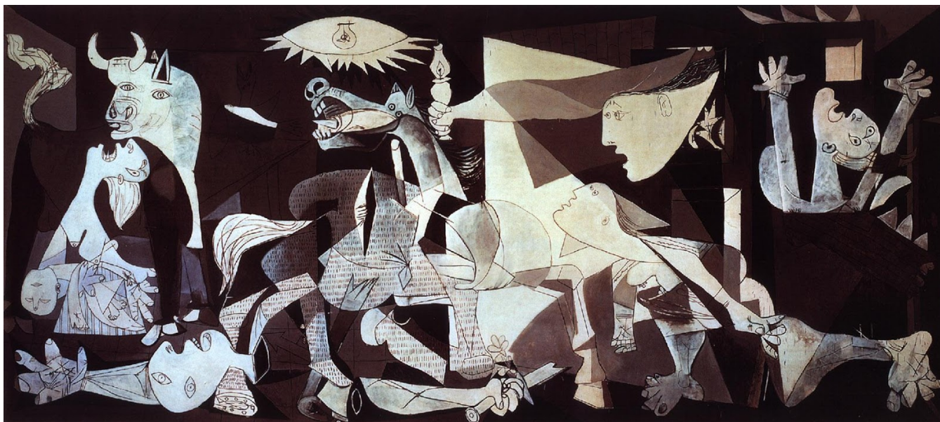
Pablo Picasso, Guernica , 1937