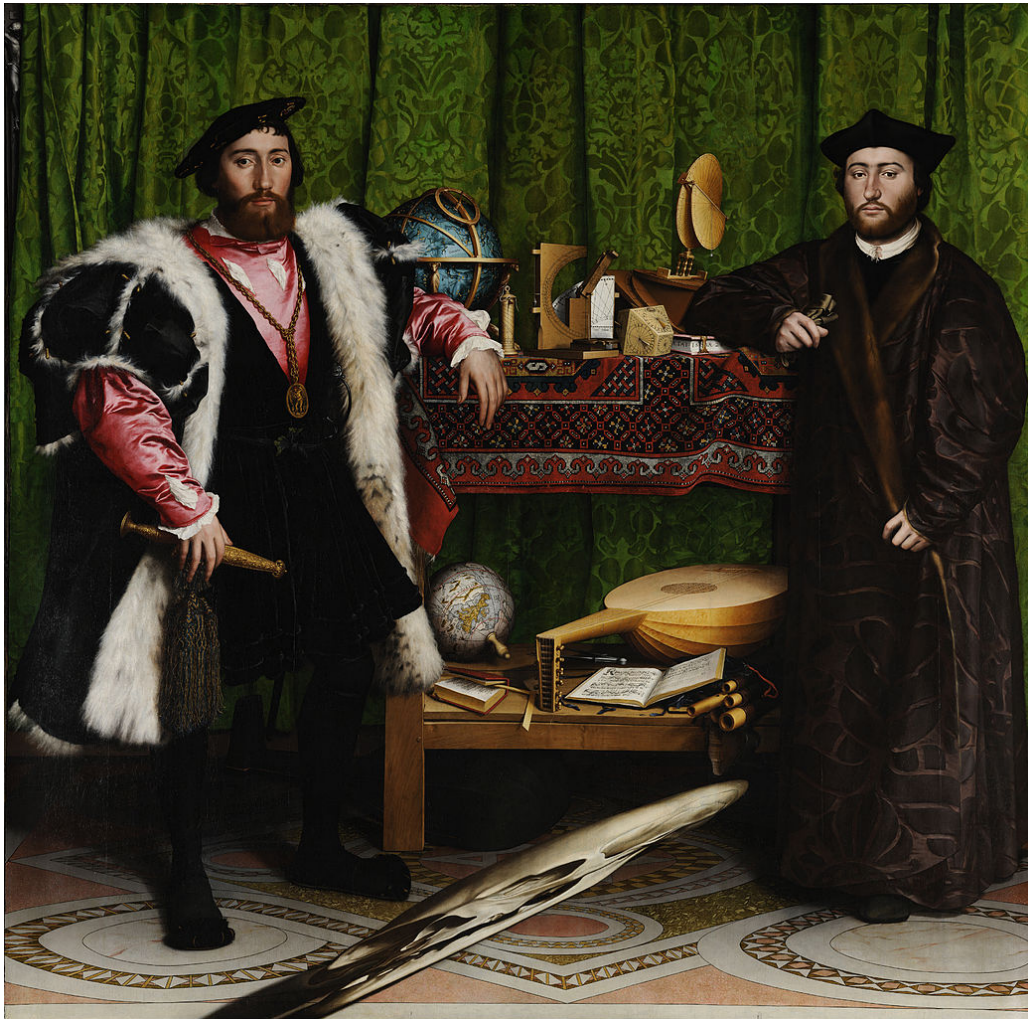
Hans Holbein, The Ambassadors , 1533